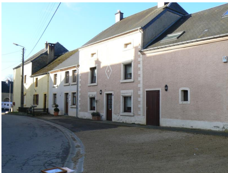
Photo 03 : Rue de la Chapelle à Sampont. Photo prise le 03-03-2015.