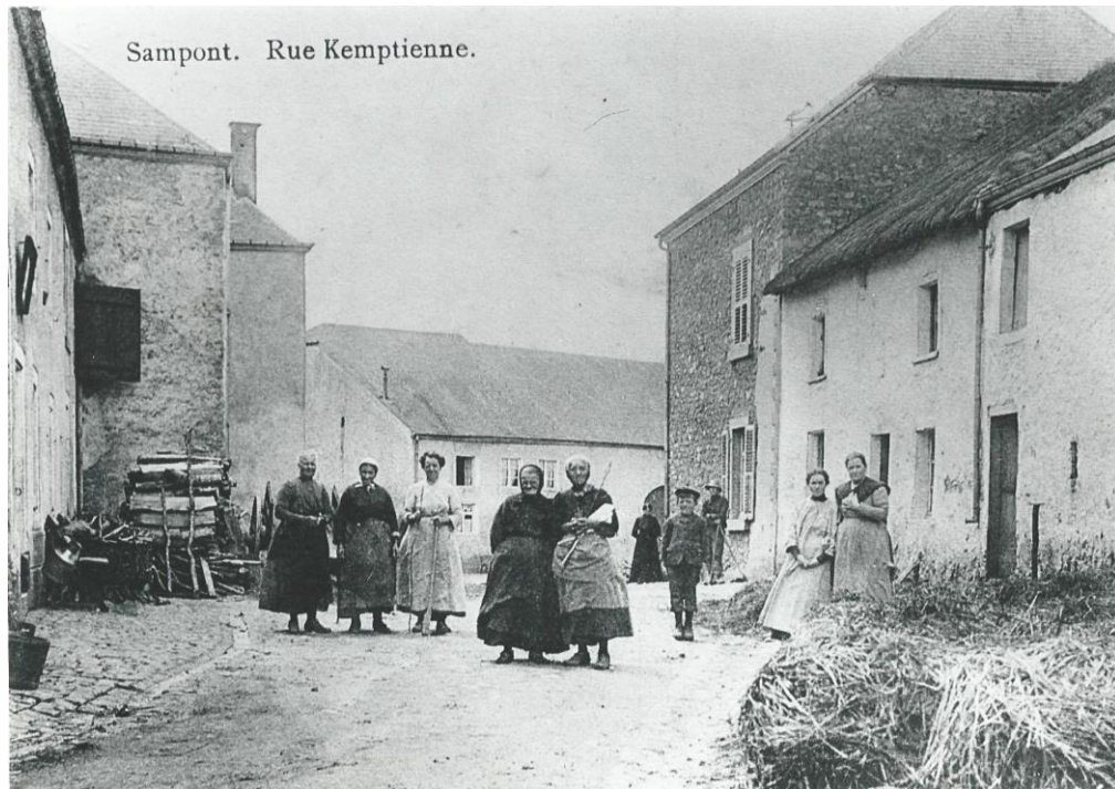
Photo 02 : Rue Kemptienne à Sampont. Carte postale ancienne. Photo prise vers 1910-1920.