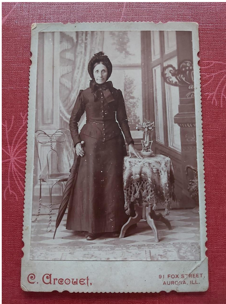
Photo 17 : Femme américaine.